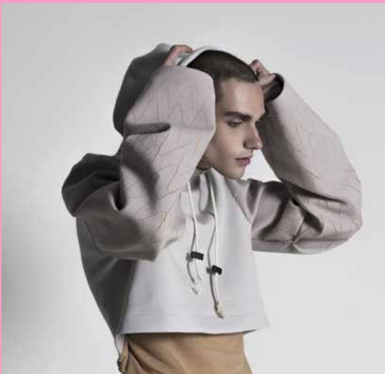
Designer : Marie Hombeline Decourcelles

If you still hesitate to choose either Design or Business, take both courses simultaneously in our 4 weeks summer program and discover the Fashion Industry from all angles.